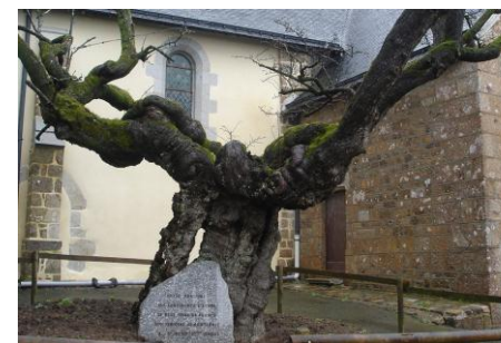
Aubépine + 1500ans